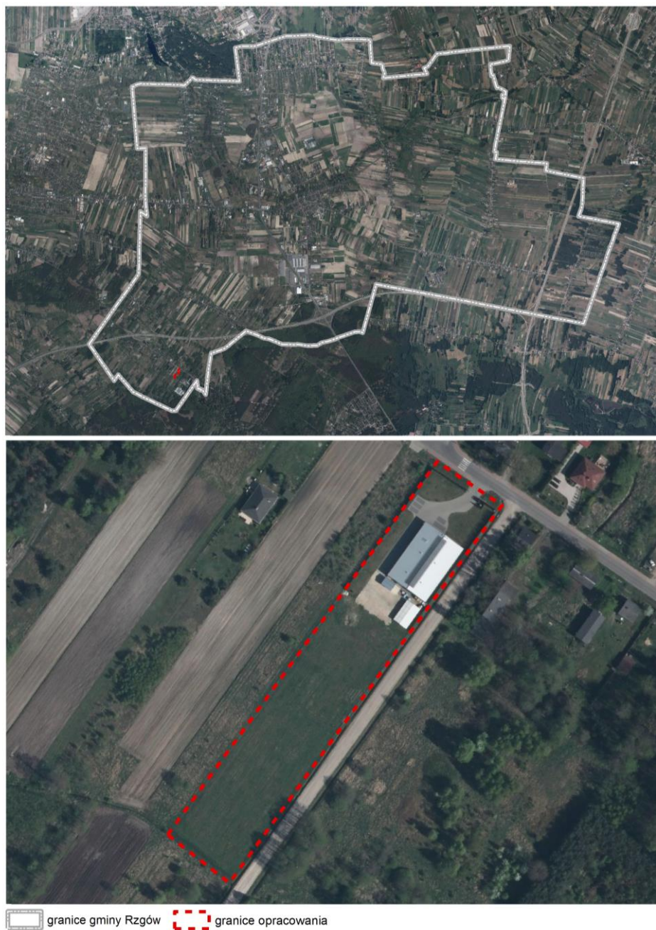
Rysunek 1 Obszar opracowania na tle gminy Rzgów.