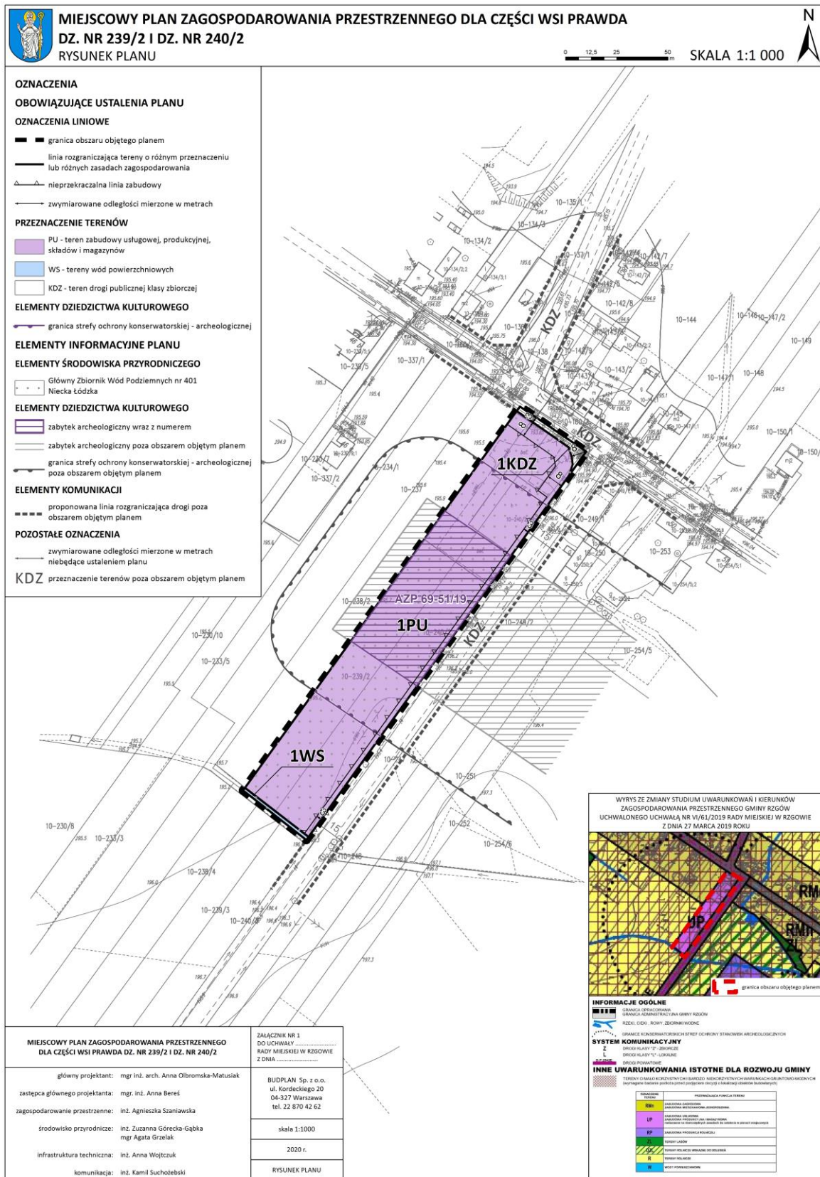
Rysunek 2 Projekt miejscowego planu zagospodarowania przestrzennego.