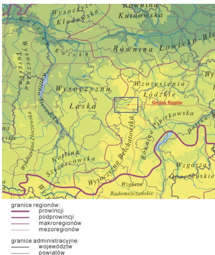
Rys. 1. Orientacyjne położenie gminy Rzgów na tle jednostek fizycznogeograficznych

Wg podziału Polski na regiony fizycznogeograficzne (regionalizacja wg J. Kondrackiego, 2001 r.), analizowany obszar leży w obrębie: prowincji Niż Środkowoeuropejski, podprowincji Niziny Środkowopolskie, makroregionu Wzniesienia Południowomazowieckie, mezoregionów Wzniesienia Łódzkie i Wysoczyzna Bełchatowska.