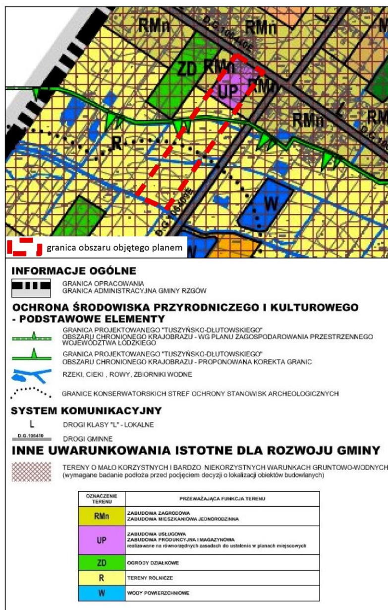
Rysunek 3. Ustalenia obowiązującego studium.

Zgodnie ze studium na obszarze objętym opracowaniem przewiduje się zabudowę usługową, produkcyjną i magazynową oraz teren rolniczy.