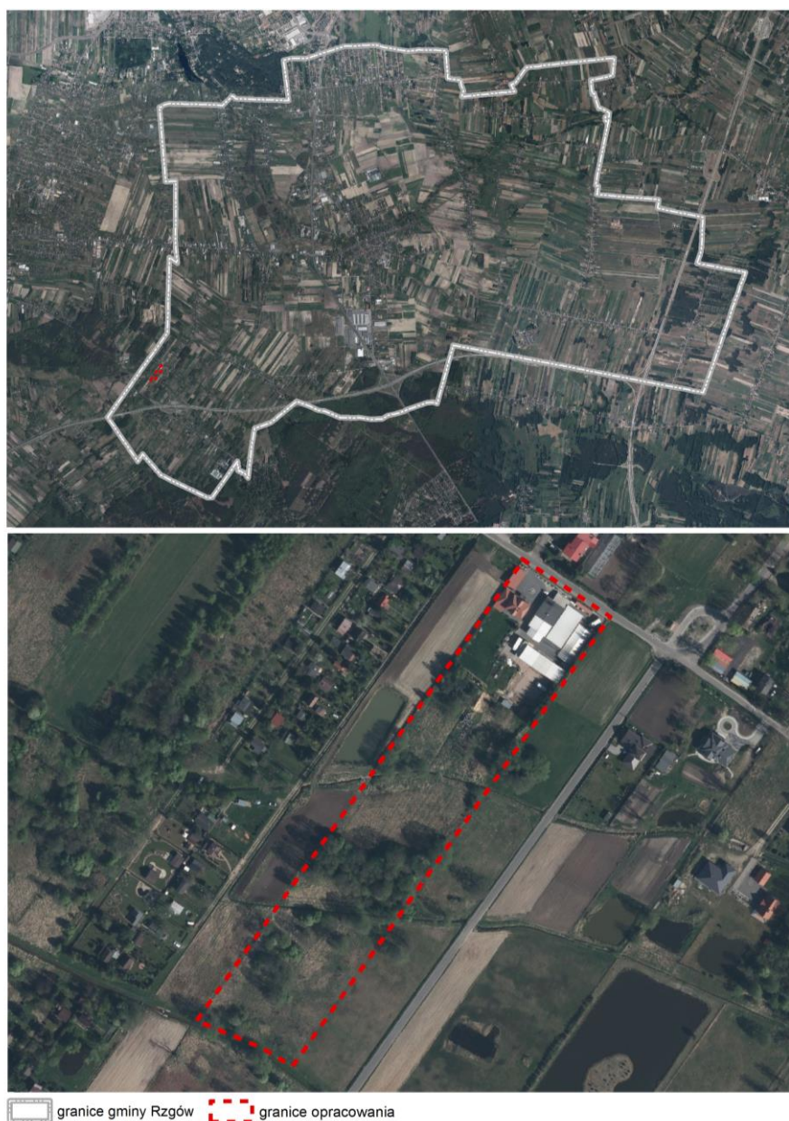
Rysunek 1. Obszar opracowania na tle gminy Rzgów.

południe od przedmiotowego terenu przebiega również droga ekspresowa S8.