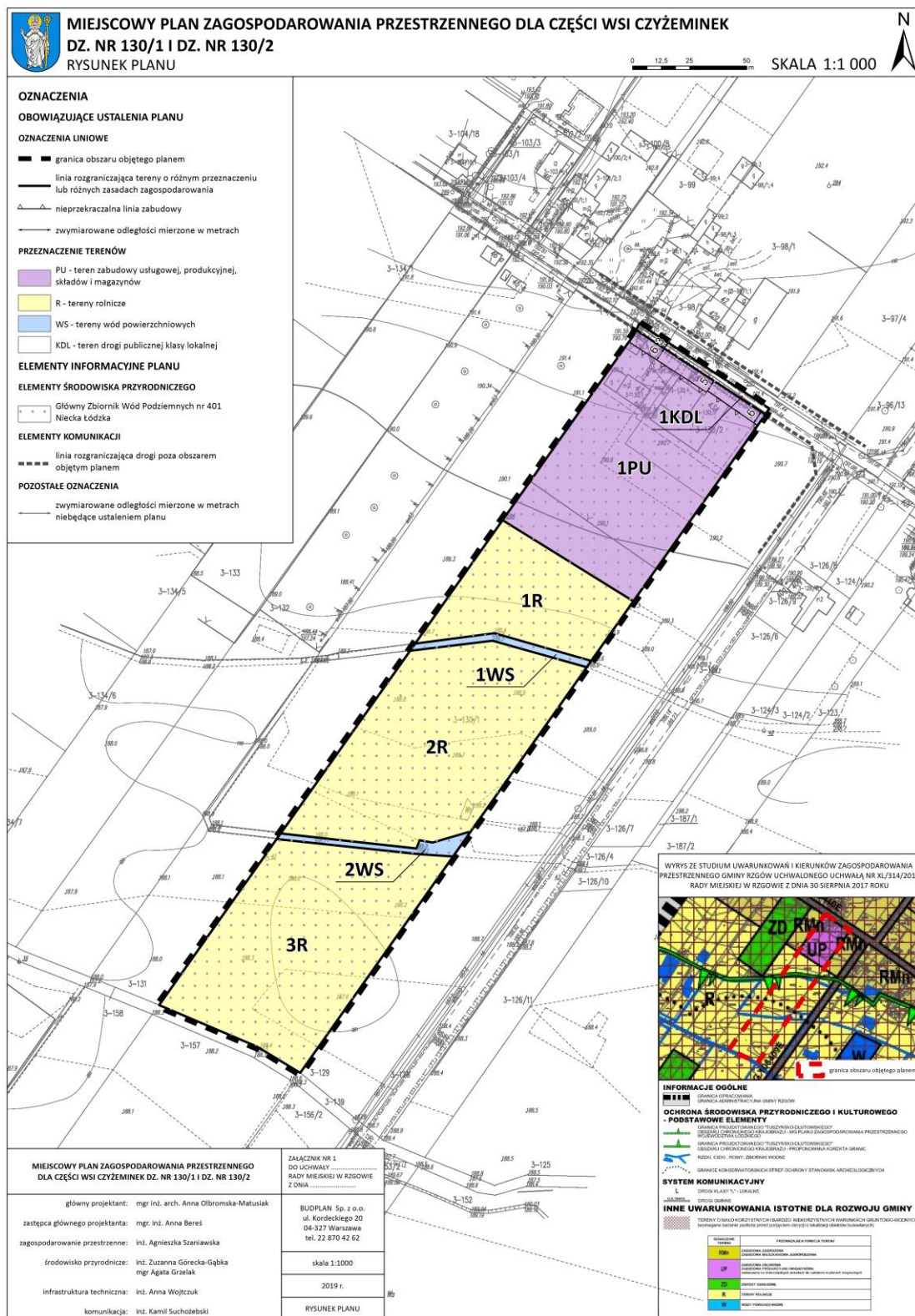
Rysunek 2. Projekt miejscowego planu zagospodarowania przestrzennego.

KDL – teren drogi publicznej klasy lokalnej.