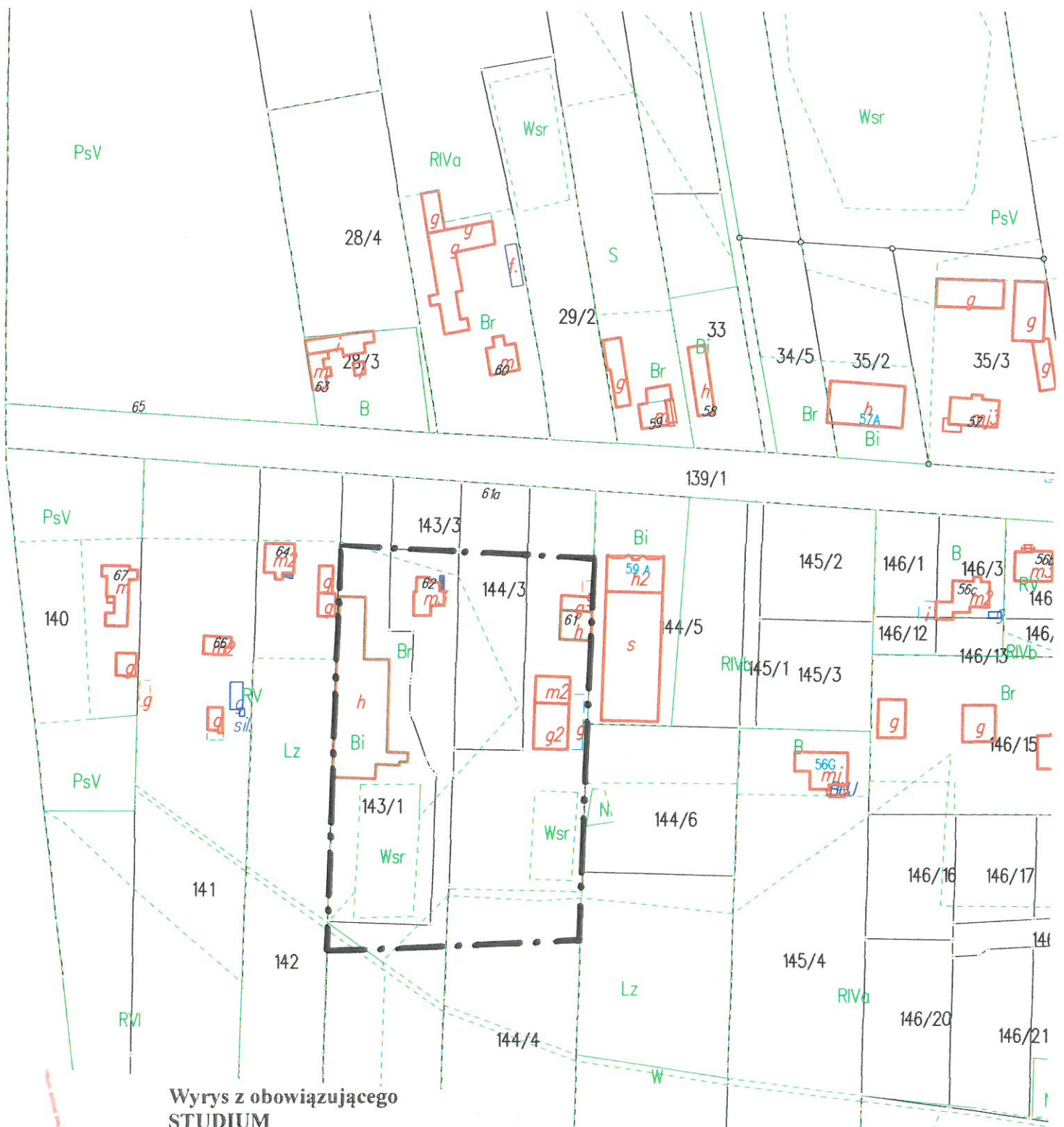
Wyrys z obowiązującego STUDIUM